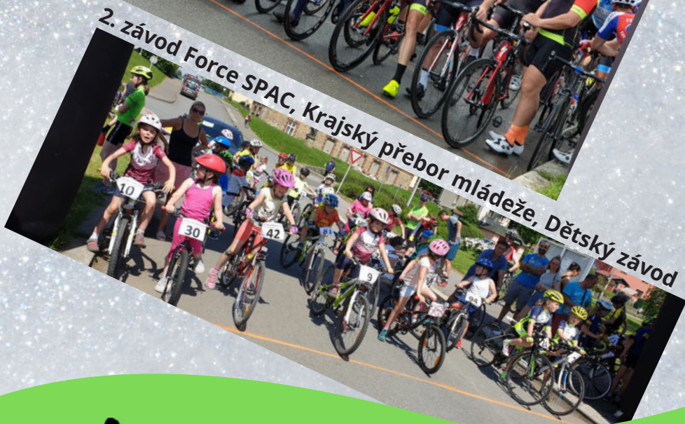
2. závod Force SPAC, Krajský přebor mládeže, Dětský závod