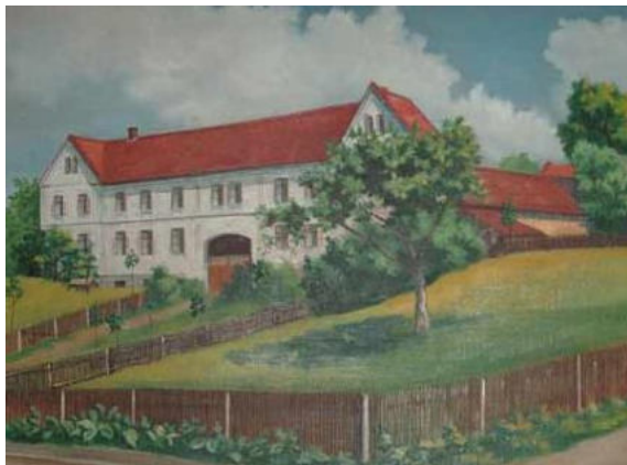
Dům čp. 126, dřívější podoba