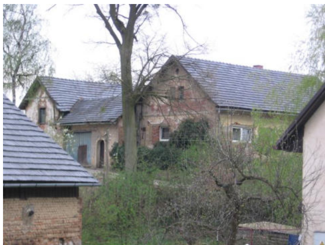
Dům čp. 90