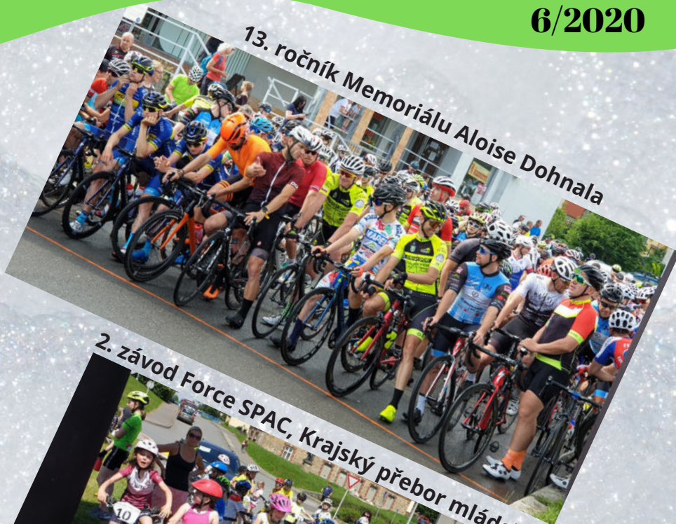
13. ročník Memoriálu Aloise Dohnala